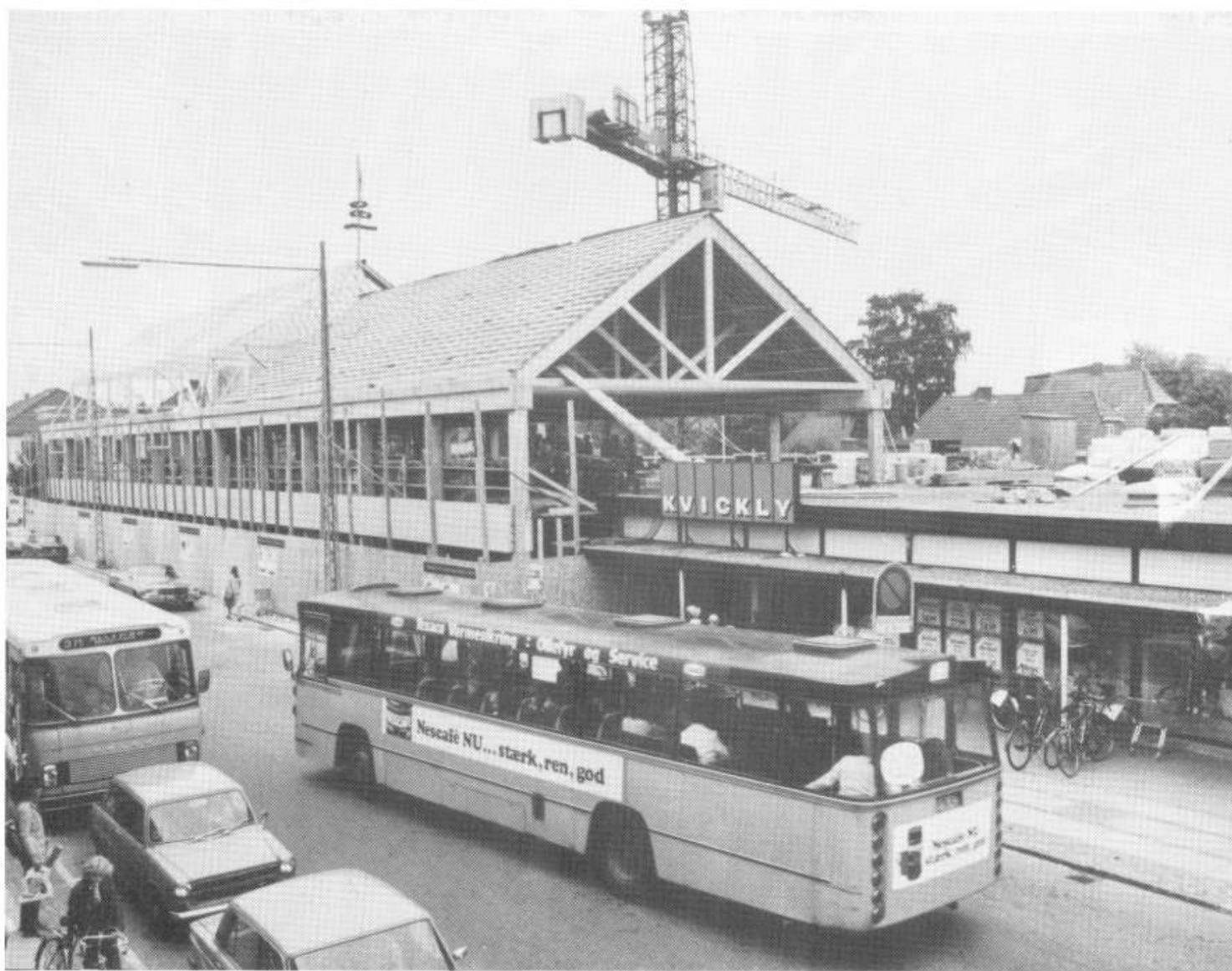
Kvickly udvider. Rejsegilde 1979.