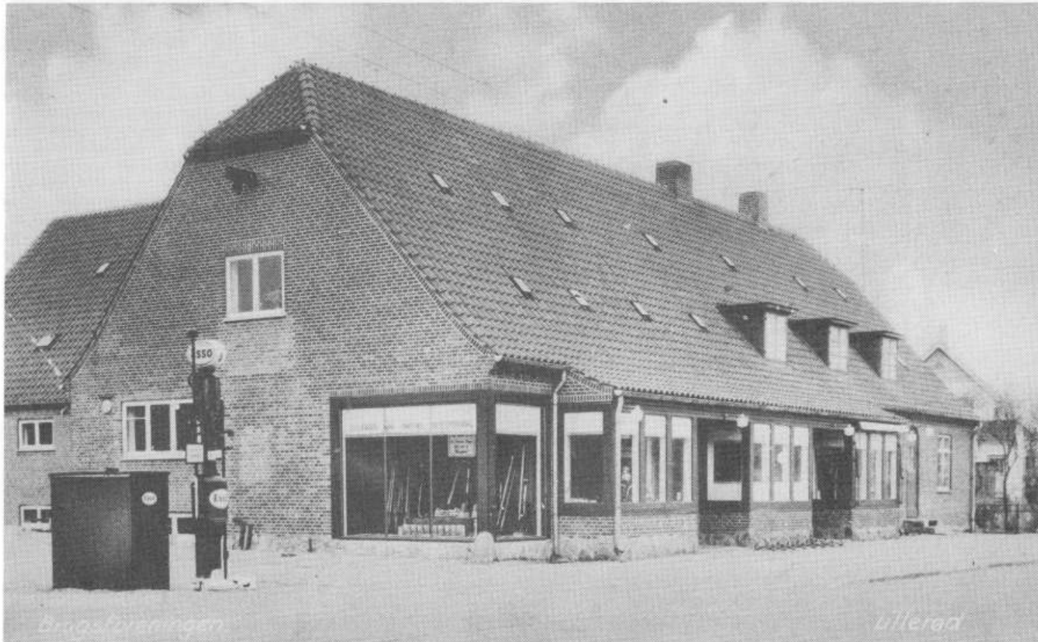
Lillerød Brugsforening. Måske fra 1941, hvor der blev fremstillet et postkort i anledning af 25-års jubilæet.