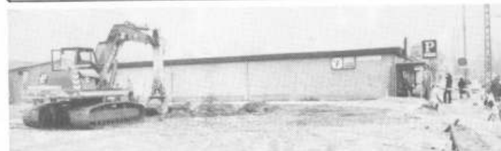
Jordarbejde til den nye bygning 1979.