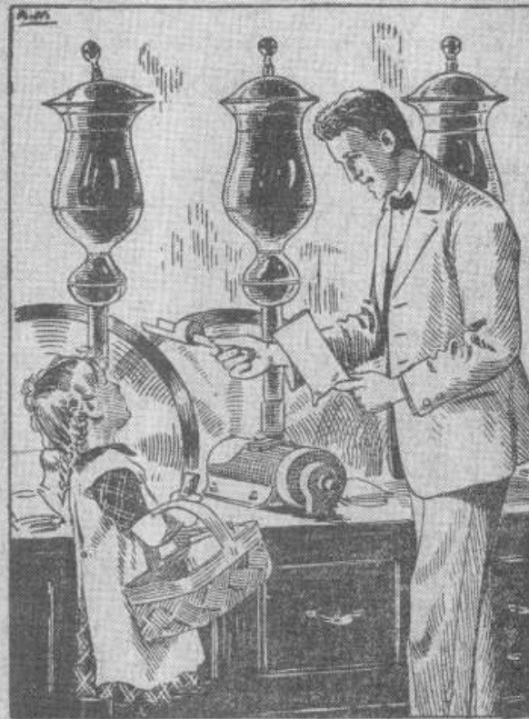
F. D. B. s KAFFERISTERI rister aarlig over 2 Mill. Kilo Kaffe.