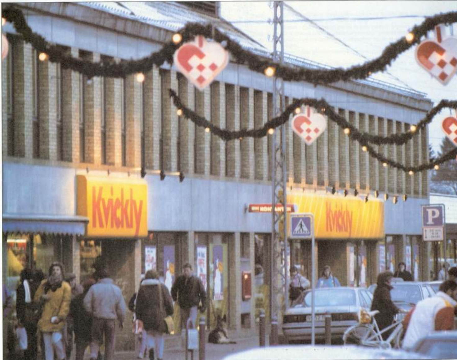
Kvickly jul 1990.