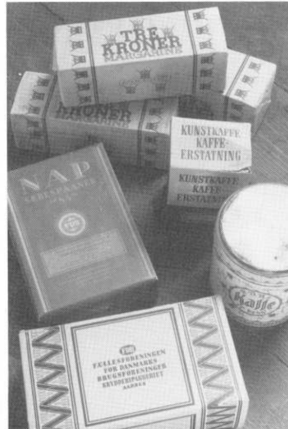
Gamle emballager.