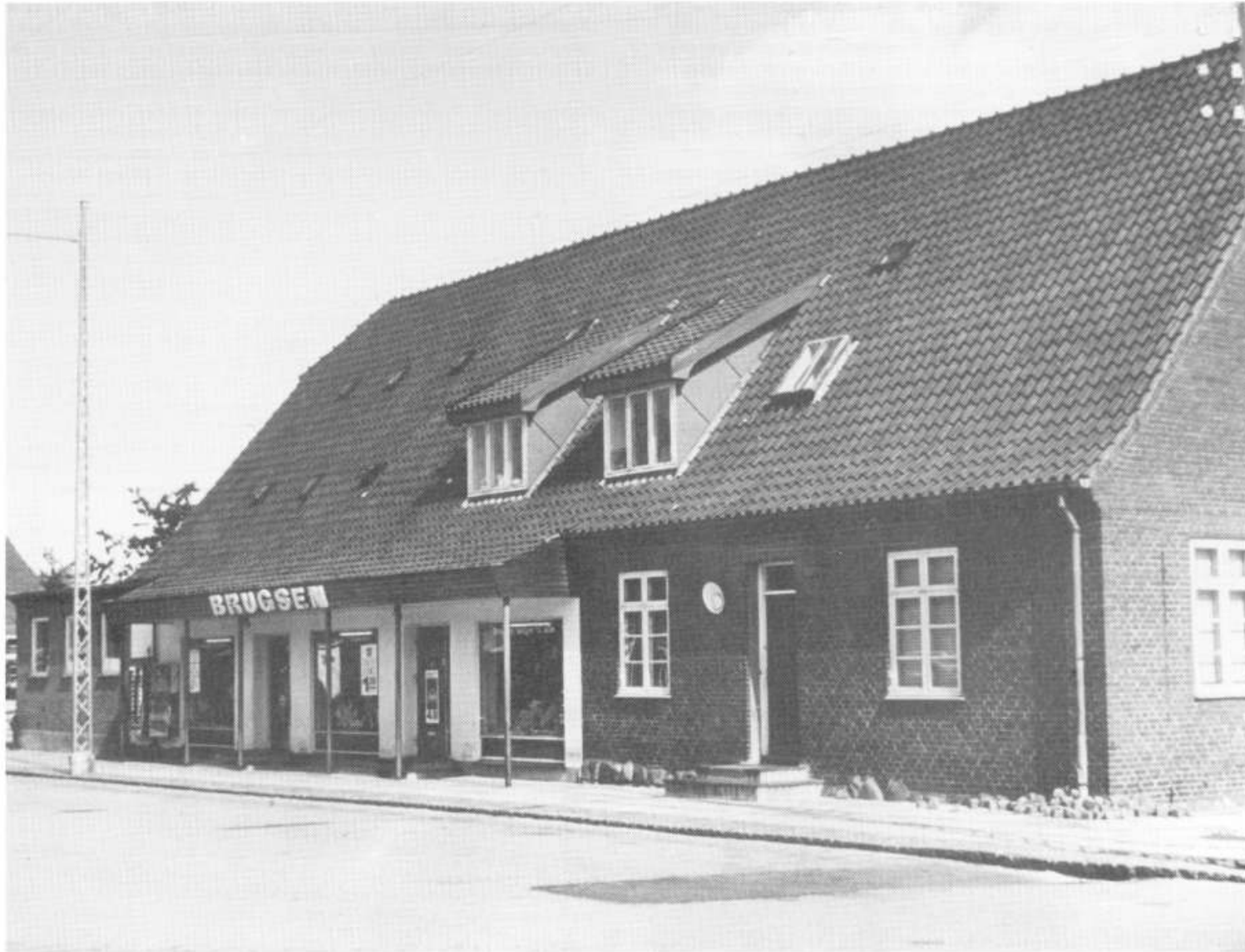
Lillerød Brugsforening 1965.